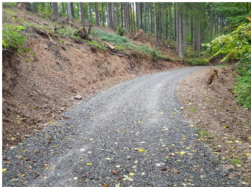
Nachher; Foto: S. Lott

Parallel dazu lief die Beauftragung der forstbetriebsnahen Stammunternehmer und Wegebauunternehmen an. Die Wiederherstellung der Rettungs-, Versorgungs- und Holzabfuhrwege vergab die Stadt Bad Münstereifel als Direktaufträge, so dass bereits Ende 2021 ca. 80 % der Wegeschäden im Stadtwald beseitigt werden konnten.