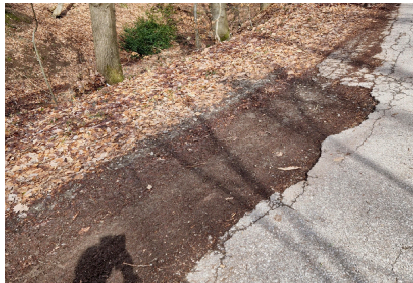
Schäden Eicherscheider Trift

So konnten erst jetzt die beiden durch die Flut stark betroffenen Stadtwaldwege mit einer Bitumendecke repariert werden: Auf einer Länge von ca. 500 Metern bekam die Arloffer Teerstraße, der so genannte Stöckweg, vom Waldwanderparkplatz Eichelkamp eine neue Teerdecke. Die alte Teerdecke wurde vor Ort recycelt, die Befahrungslasten neu berechnet und die Kurven stabilisiert.