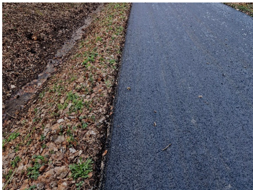
ab Eichelkamp, Arloffer Straße - Stöckweg ; Foto: S. Lott

Ebenso wurde die Eicherscheider Trift, hinter Eicherscheid Richtung Rodert, auf ca. 250 Metern instandgesetzt. Damit ist der letzte, von der Flut betroffene Waldweg, der in der Zuständigkeit des Forstbetriebes liegt, wiederhergestellt.